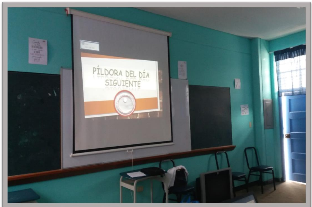
Ejecución de la Charla