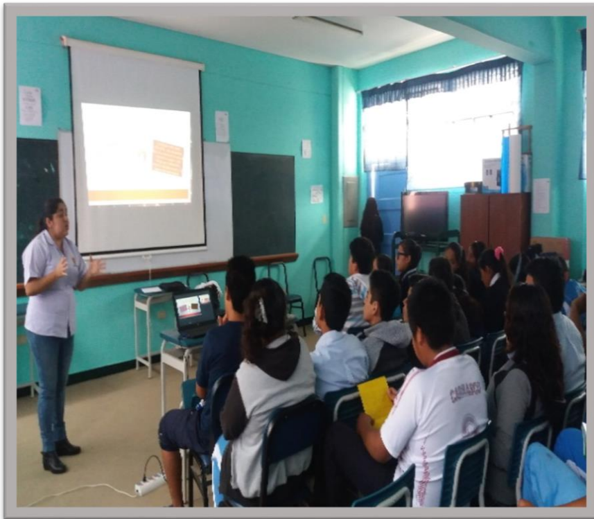
Ejecución de la Charla