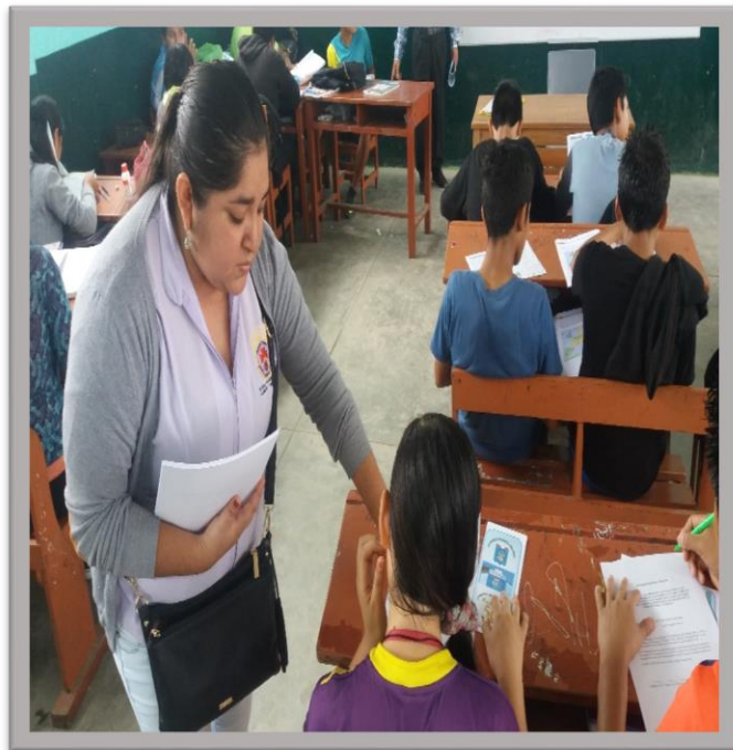
Entrega del cuestionario