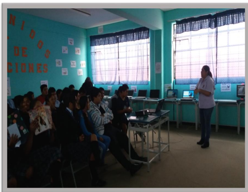
Ejecución de la Charla