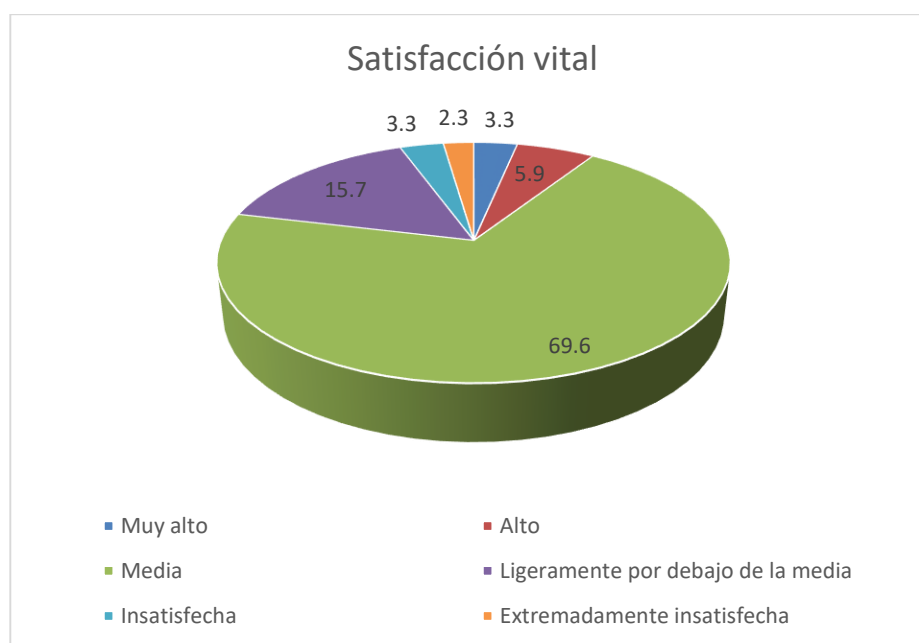
Figura 1. Gráfico circular porcentual del nivel de Satisfacción vital de los efectivos policiales de la División Policial, Chimbote, 2017