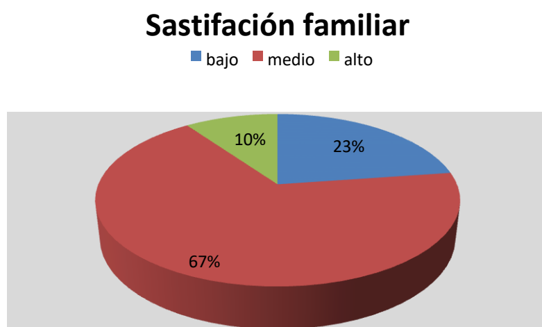
Figura 1 Gráfico circular del nivel de Satisfacción familiar prevalente en estudiantes de una Institución Educativa, 2018