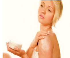
Cremas y ungüentos

9¿Qué antibiótico (s) toma con más frecuencia?