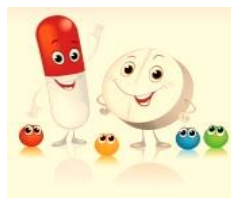
Tabletas y cápsulas

Si su respuesta es sí, que tipo de medicamento es: