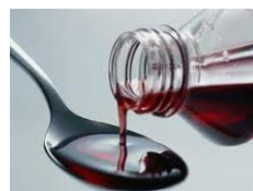
Jarabe y suspensión