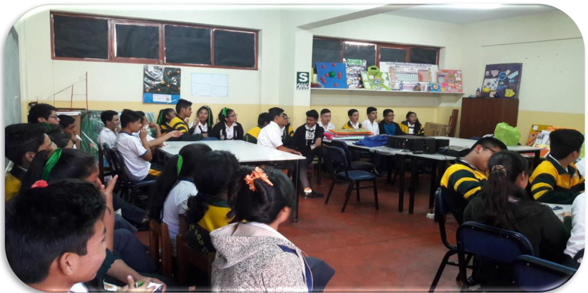
Imagen 6. Fotografía realizando la exposición sobre el uso adecuado de anticonceptivos hormonales.