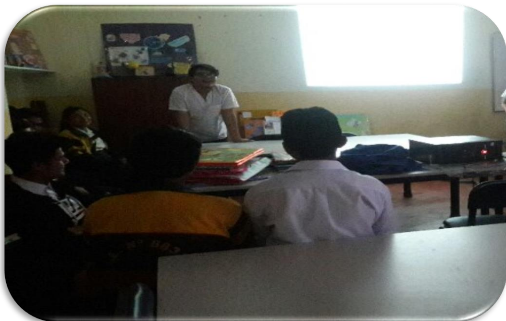
Imagen 4. Fotografía realizando la exposición sobre el uso adecuado de anticonceptivos hormonales.