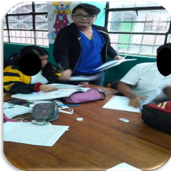
Imagen 2. Fotografía realizando el test de análisis a mujeres adolescentes del centro educativo.