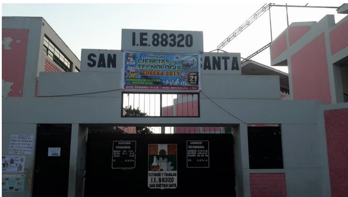
Imagen 9. Fotografía frontal del centro educativo donde se realizó la investigación.