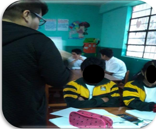
Imagen 3. Fotografía realizando la explicación del proceso de llenado del test a los adolescentes del centro educativo.