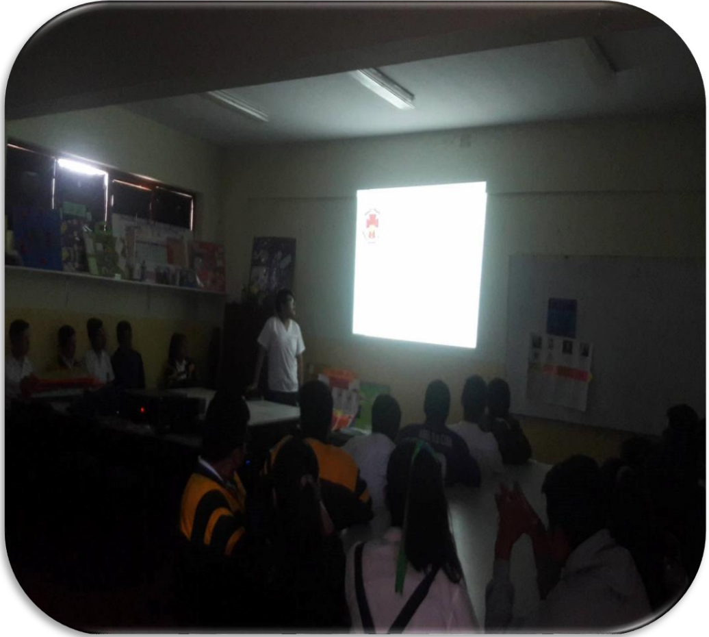
Imagen 7. Fotografía realizando la exposición sobre el uso adecuado de anticonceptivos hormonales.