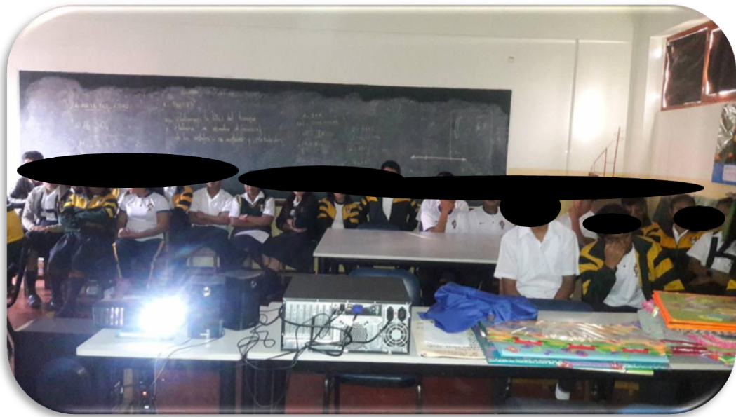
Imagen 5. Fotografía realizando la exposición sobre el uso adecuado de anticonceptivos hormonales.