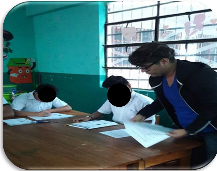
Imagen 1 Fotografía realizando el test de análisis a varones adolescentes del centro educativo.