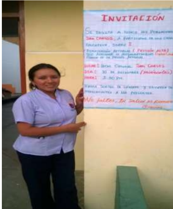
INVITACIÓN PARA EL DÍA DE LA CHARLA EDUCATIVA, CENTRO POBLADO, SAN CARLOS- SANTA-SANTA