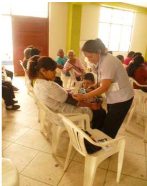
TOMA DE PRESIÓN ARTERIAL A LOS ASISTENTES EN EL DÍA DE LA CHARLA. , CENTRO POBLADO, SAN CARLOS- SANTA- SANTA