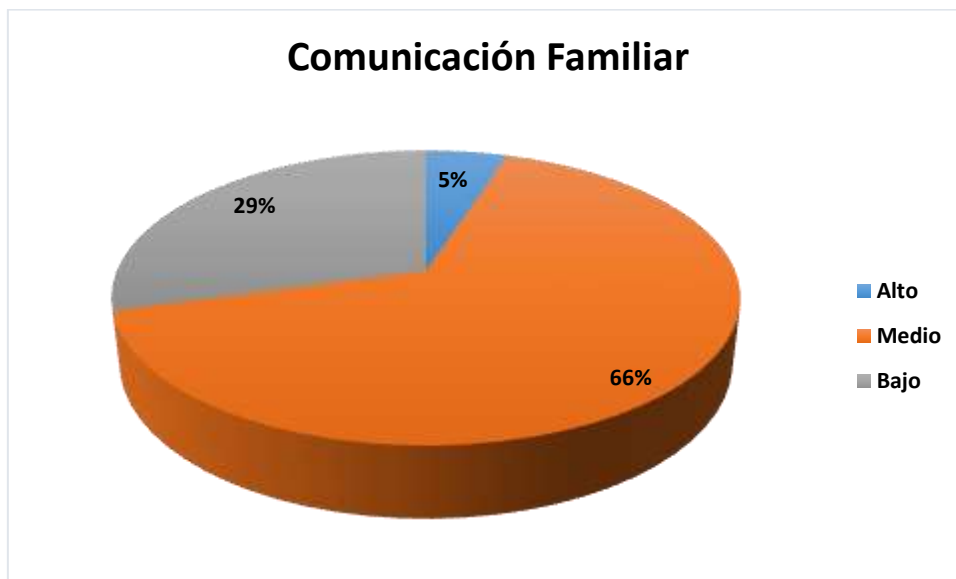
Figura 1. Gráfico circular del nivel de comunicación familiar prevalente en estudiantes de una institución educativa nacional Gloriosa 329 N°89002, Chimbote, 2018.