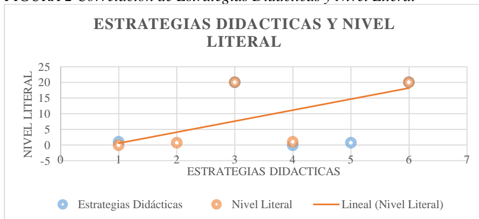
FIGURA 2 Correlación de Estrategias Didácticas y Nivel Literal