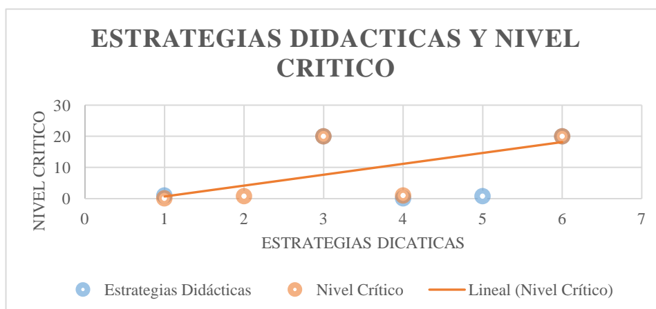
FIGURA 4 Correlación Estrategias Didácticas y el Nivel Crítico