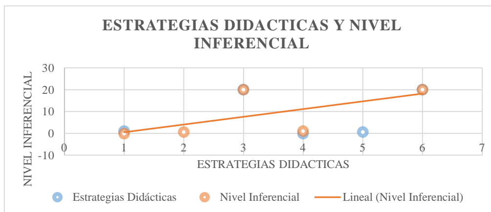
FIGURA 3 Correlación Estrategias Didácticas y el Nivel Inferencial