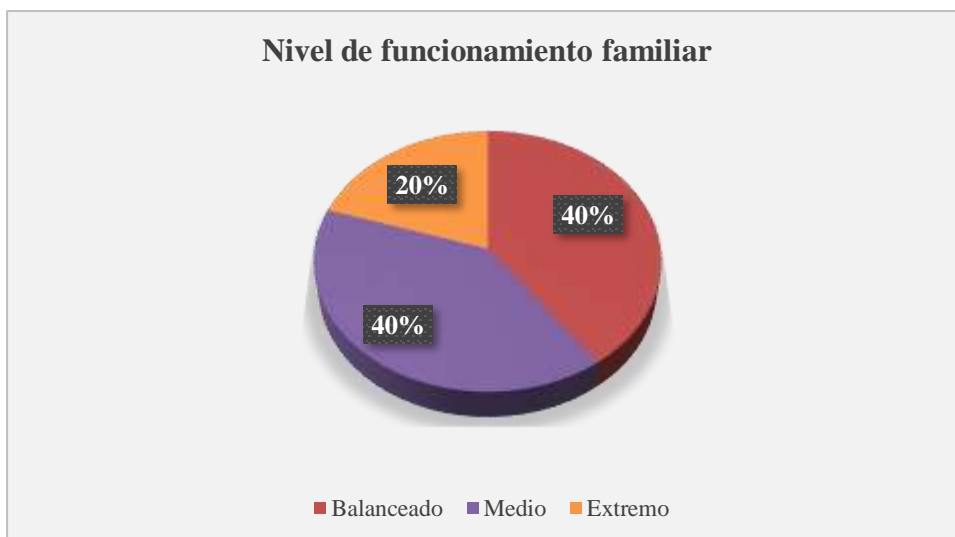
Gráfico circular del nivel del funcionamiento familiar de los estudiantes de secundaria de la institución educativa Simón Bolívar- Huaraz, 2020.

Nota: El nivel de funcionamiento familiar de los estudiantes es de nivel balanceado y medio con 40%, y nivel extremo con 20%.