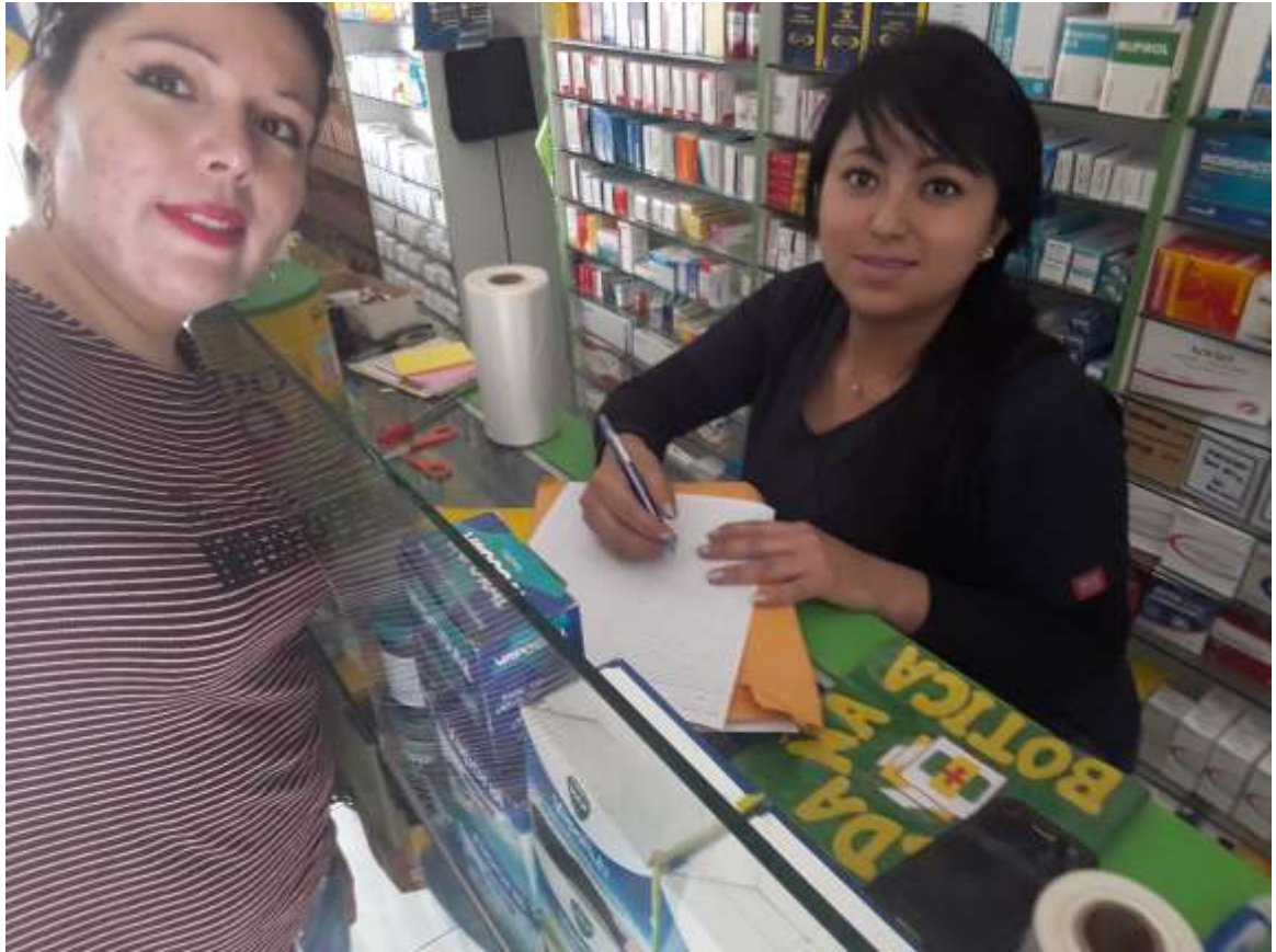
REALIZANDO LA ENCUESTA AL PERSONAL DE LA BOTICA