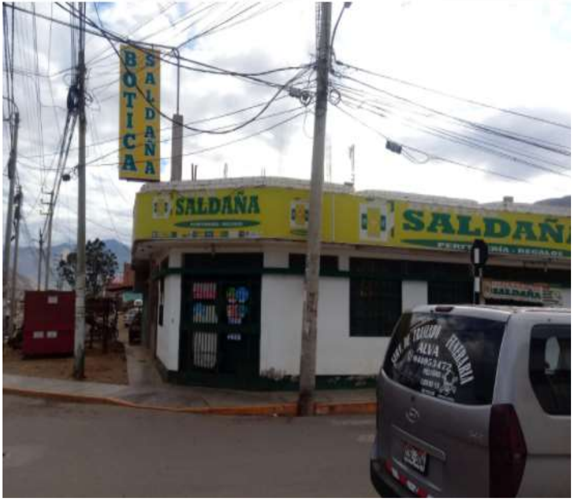
LA BOTICA SALDAÑA