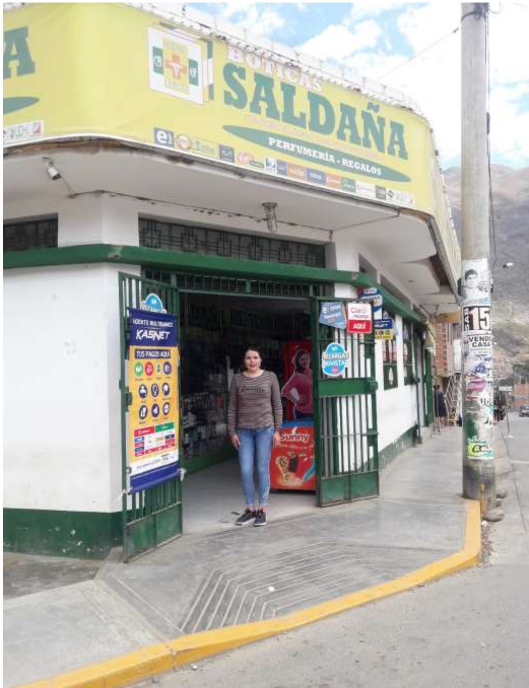
VISITANDO EL LOCAL DE LA BOTICA SALDAÑA