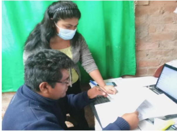
Encuesta realizada en la Comisión de Usuarios