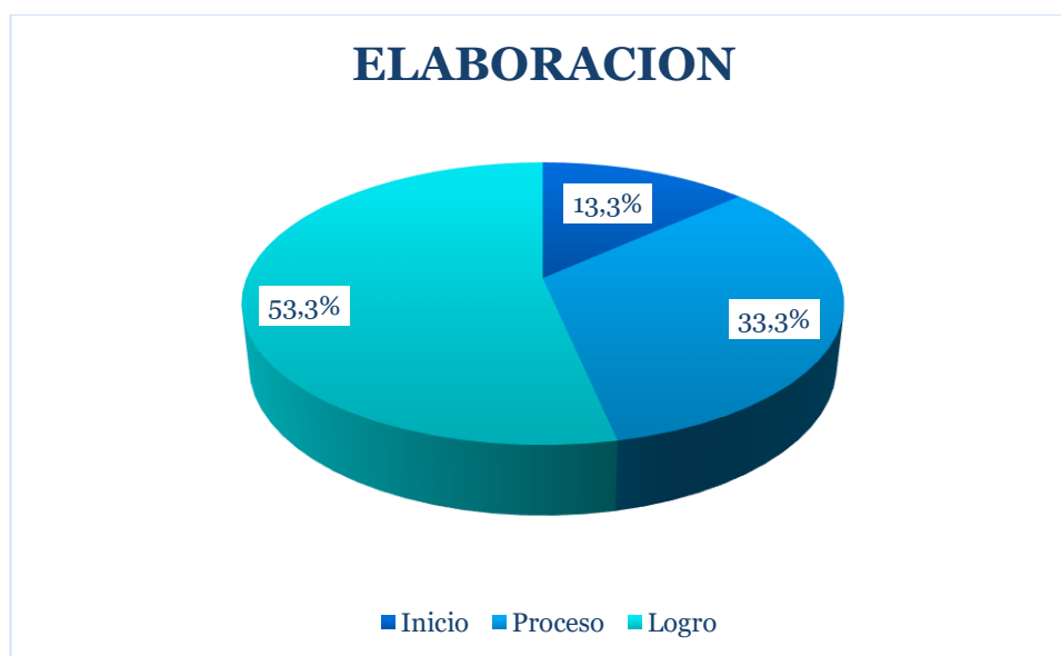
Gráfico 4. Elaboración en niños y niñas de 5 años de la Institución Educativa Inicial N°402/Mx-/P de palmapampa, Ayacucho-2019.