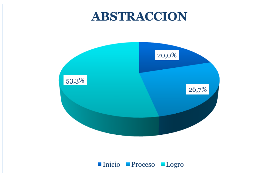
Gráfico 3. Abstracción en niños y niñas de 5 años de la Institución Educativa Inicial N°402/Mx-/P distrito de samugari, provincia La Mar, Ayacucho-2019.