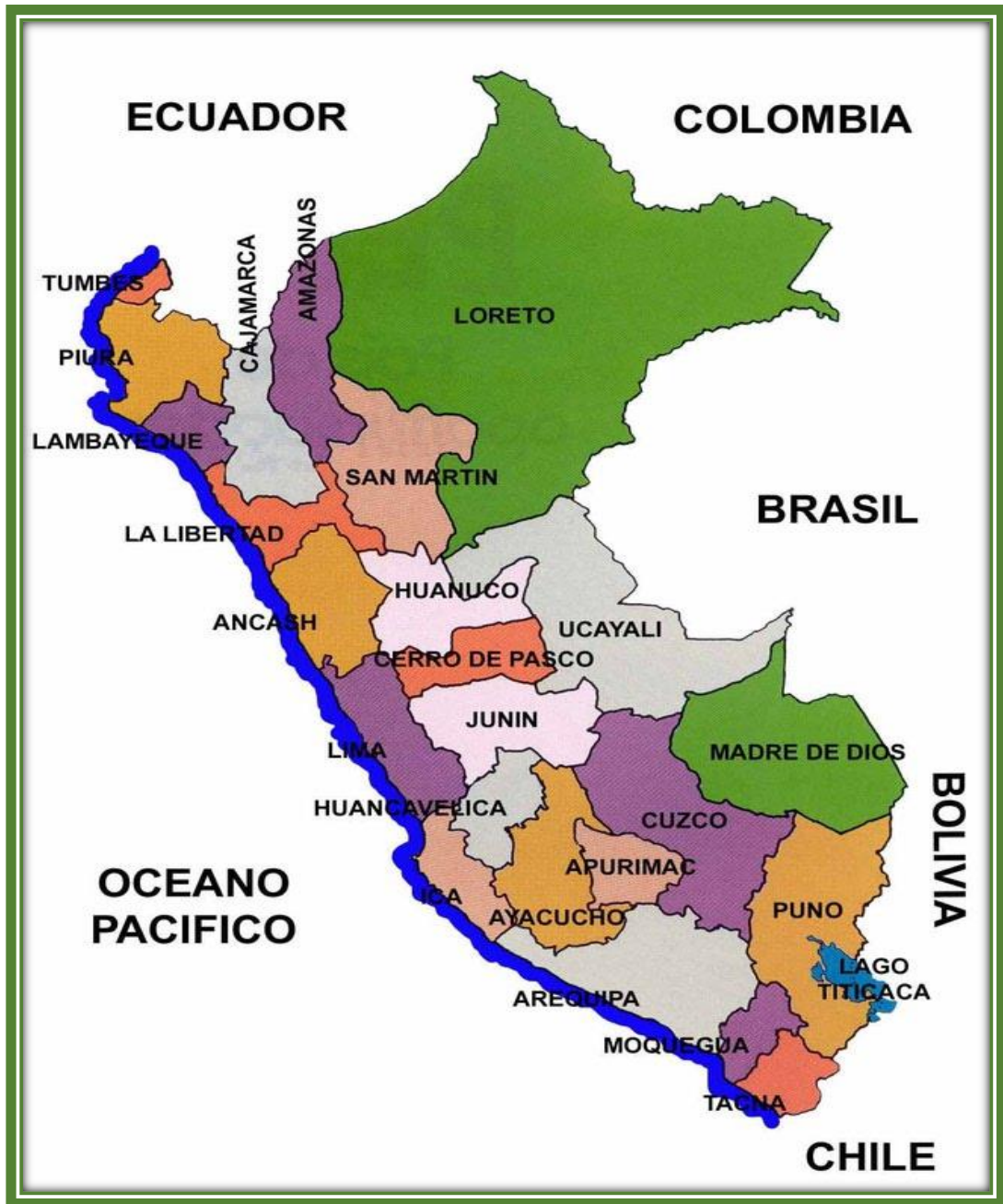
Anexo 02: Mapa del Departamento del Perú