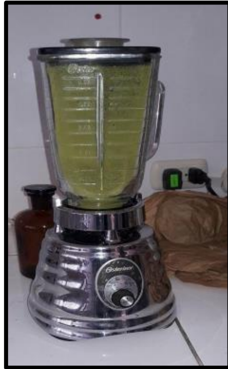
Anexo 5: Muestra triturada de las hojas de Chenopodium album L.