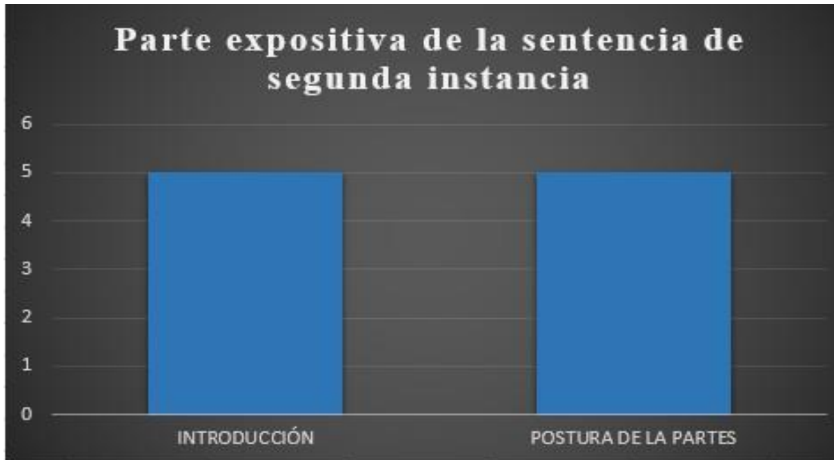
GRAFICO N° 4