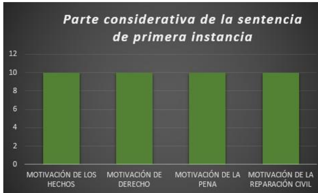
GRAFICO N° 2