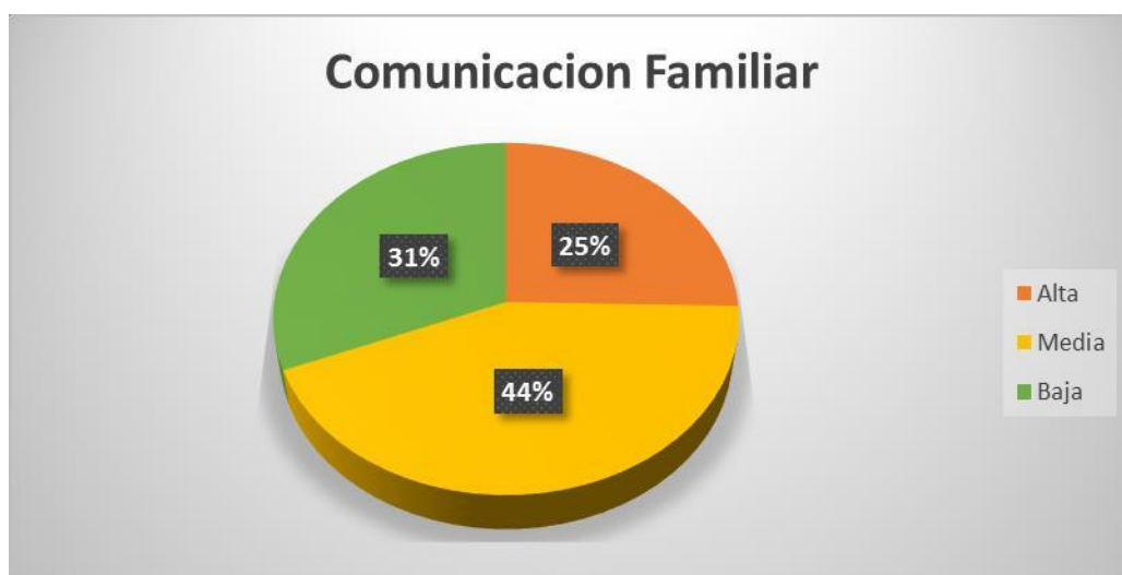
Figura 2: Descripción de la comunicación familiar de los estudiantes de secundaria del colegio La Libertad, Huaraz, 2018.

Descripción: la comunicación familiar es Media.