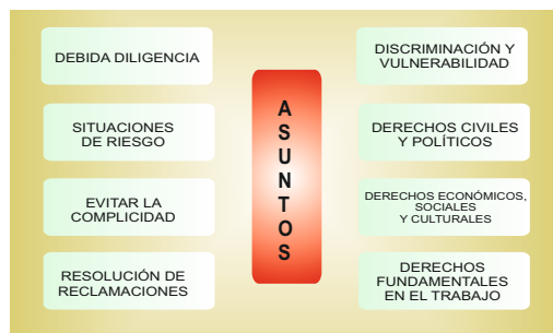
Figura N° 03