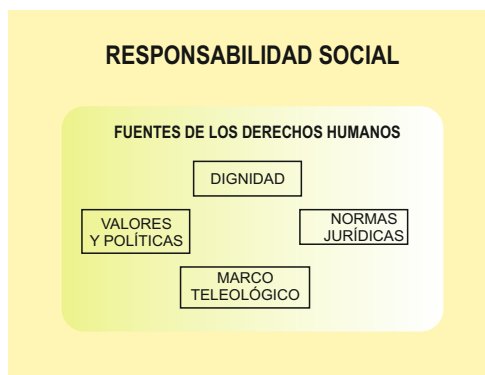
Figura N° 02