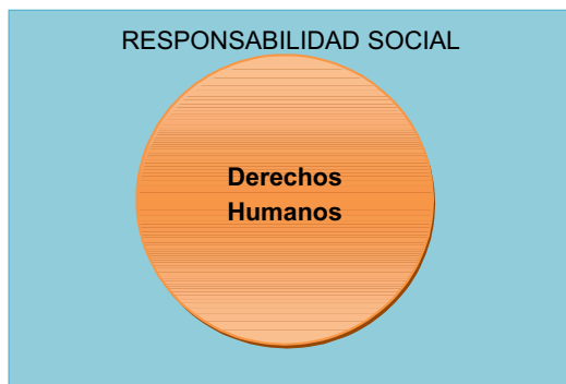
Figura N° 01

Fuente: Elaboración del autor para representar los derechos humanos en la responsabilidad social (2012)