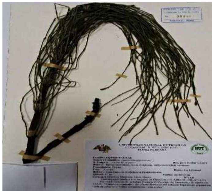
ANEXO N° 2. CERTIFICACION DE PLANTA De Equisetum giganteum L “Cola De Caballo” EN EL HERBARIO –HUT.