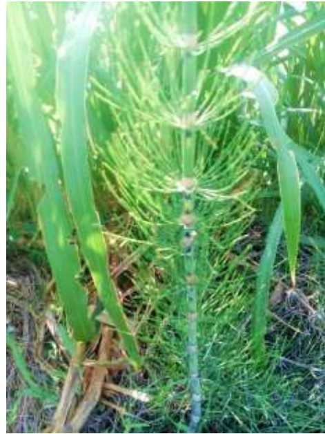
ANEXO N° 1. LUGAR DE RECOLECCIÓN DE Equisetum giganteum L “COLA DE CABALLO”