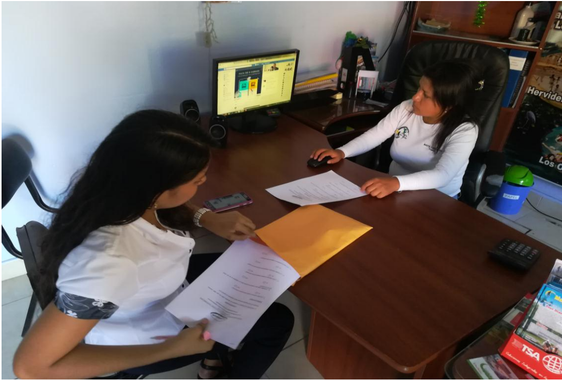
ENCUESTA APLICADA A LA EMPRESA MAYTE TOURS.