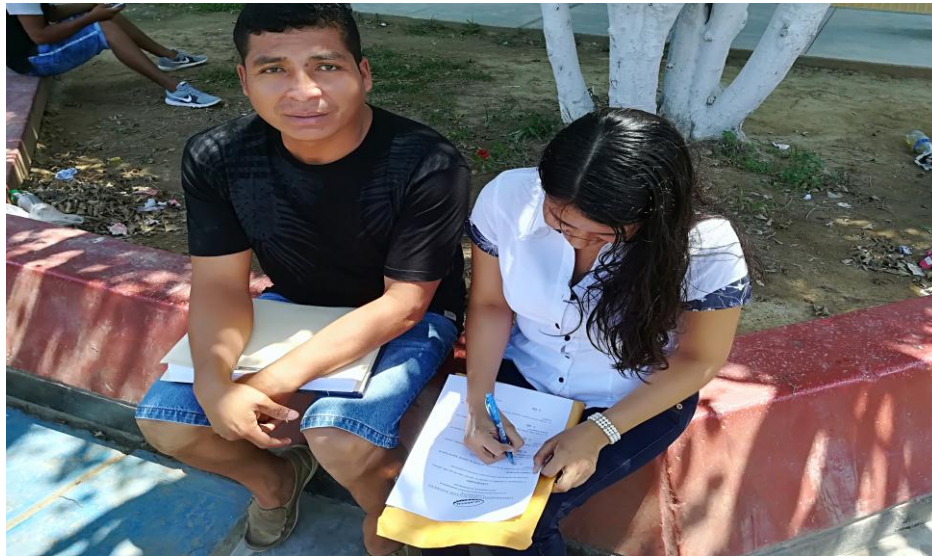
ENCUESTA APLICADA AL CLIENTE DE LA AGENCIA GUÍAS DE TURISMO