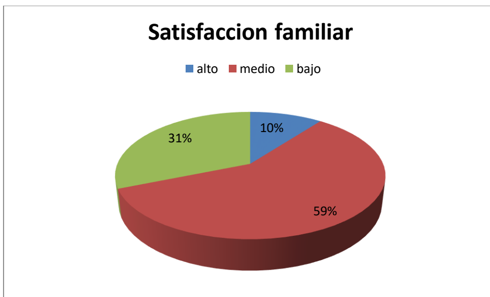
Figura 1. Gráfico Circular de la Satisfacción familiar prevalente de los estudiantes de una institución educativa, Chimbote, 2018.