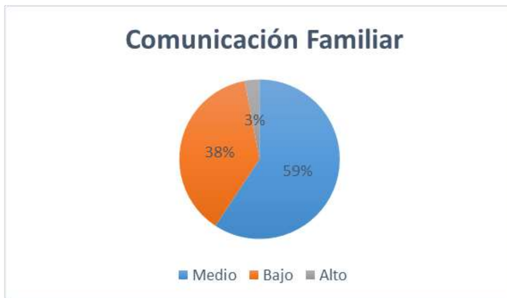
Figura 1: Gráfico circular de la comunicación familiar en estudiantes de una Institución Educativa Nacional, Nuevo Chimbote, 2018.