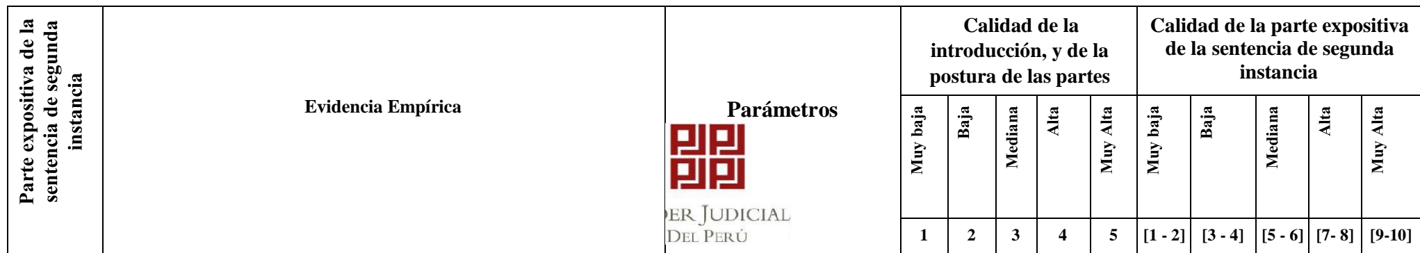
Cuadro 4: Calidad de la parte expositiva de la sentencia de segunda instancia, VIOLACIÓN SEXUAL DE MENOR DE EDAD; con énfasis en la calidad de la introducción y de la postura de las partes, en el expediente N° 0649-2013-55-3101-JR-PE-01, del Distrito Judicial de Sullana – Sullana.2017