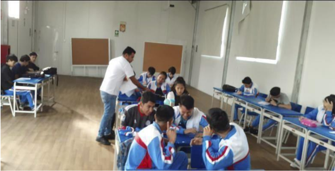
Compartiendo la charla