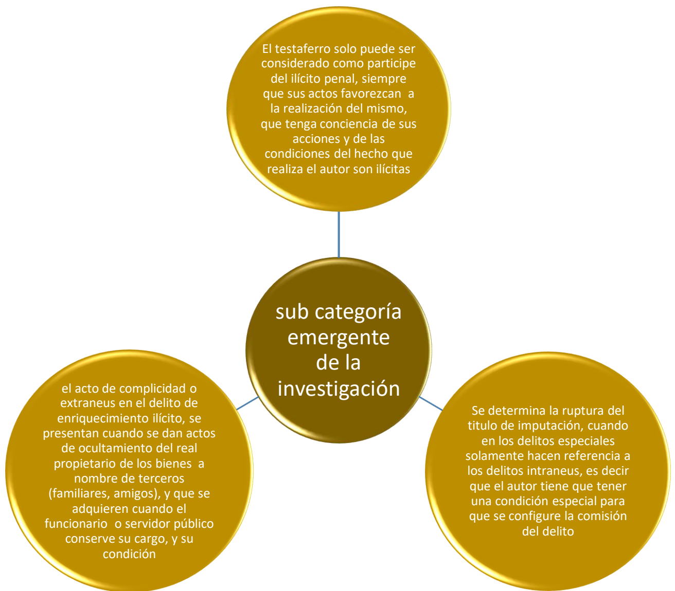
Fig. 4: Sub categoría emergente de la investigación