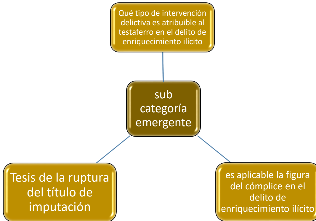
Fig. 3: Sub categoría emergente