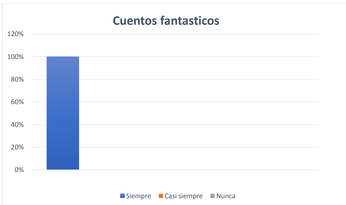
Gráfico 1.- Distribución de la escala de calificación de cuentos fantásticos en los estudiantes.

Interpretación. En la tabla 3 y gráfico 1, se observa que en la dimensión cuentos fantásticos, el 100% de los niños hace uso de los cuentos de hadas, fabula y leyenda.