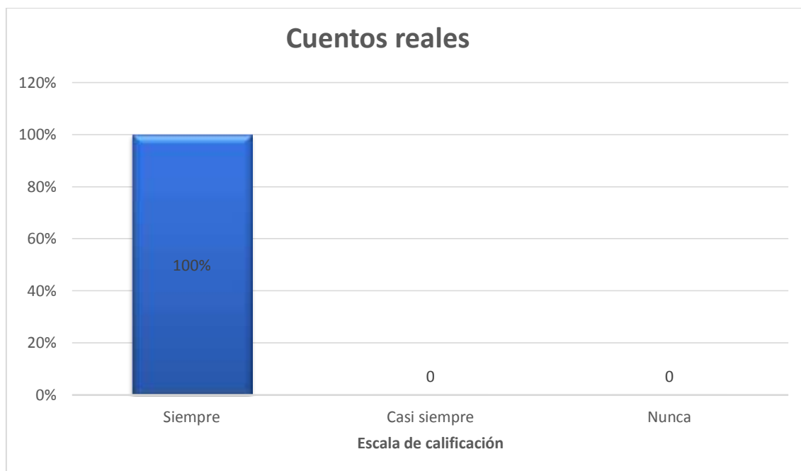
Grafico1.- Distribución de la escala de calificación de cuentos reales en los estudiantes.