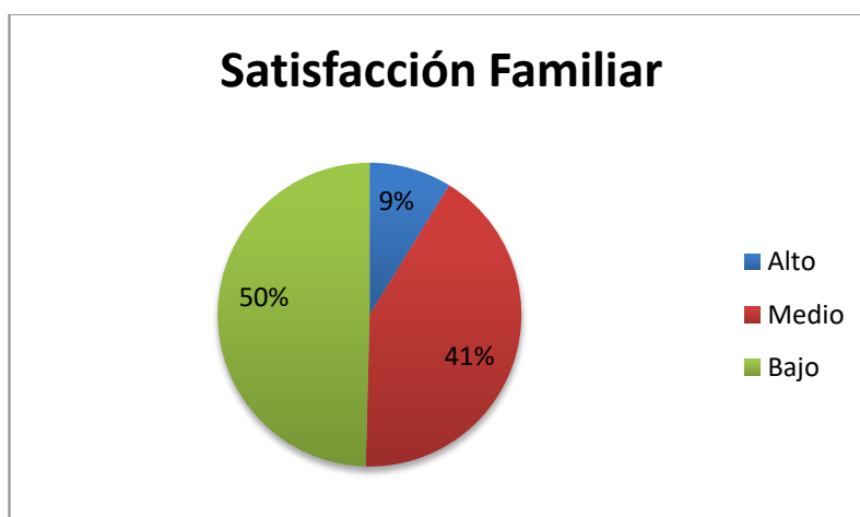
Grafico circular de la satisfacción familiar en estudiantes de una institución educativa de Marcará, 2022.

Nota: De la población estudiada la mayoría, el (50%) de los estudiantes presenta una satisfacción familiar baja.