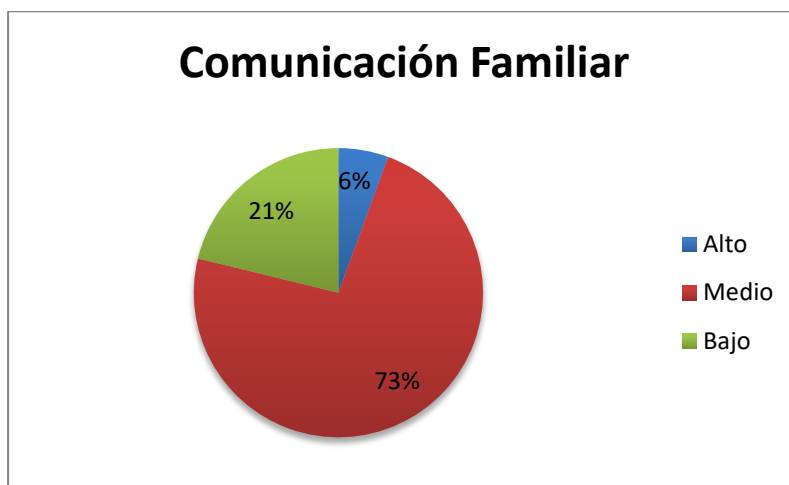
Grafico circular de la comunicación familiar en estudiantes de una institución educativa de Marcará, 2022.

Nota: De la población estudiada la mayoría, el (73%) de los estudiantes presenta una comunicación familiar media.