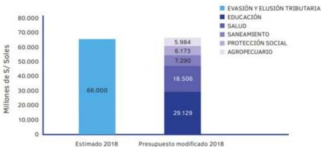
Ilustración 6: Evasión tributaria en el Perú en el año 2018 Fuente: (MEF, 2018)

Se reconoce a la evasión tributaria como la falta de cumplimiento de las obligaciones tributarias, esta falta de cumplimiento de forma general hace que el fisco reciba una menor cantidad de ingresos, la evasión tributaria es pagar menor cantidad de impuestos o no pagarlos teniendo plena conciencia de la omisión que se está haciendo (Chavez & Tadeo , 2018).