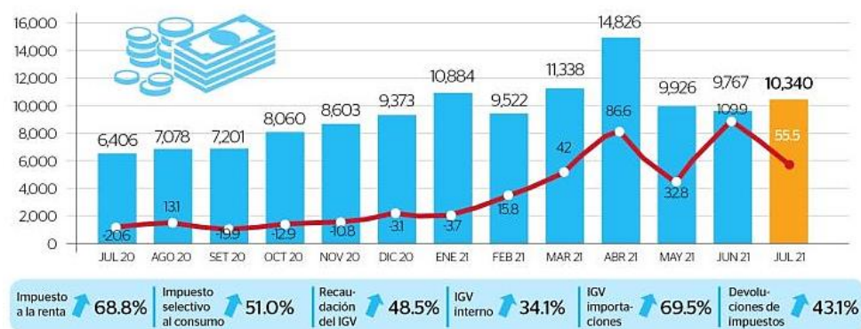
Ilustración 1: Ingresos Tributarios Netos 2020-2021

En millones de soles y Var. % real anual