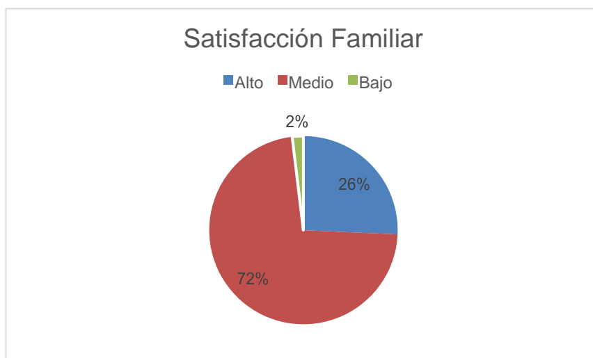
Figura 1. Gráfico circular de la distribución porcentual de la Satisfacción familiar prevalente en estudiantes de la institución educativa nacional “Augusto Salazar Bondy, Nuevo Chimbote, 2018