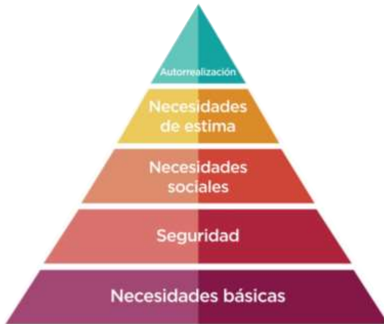
Gráfico 1 Teoría de la Jerarquía de Necesidades A. Maslow

De acuerdo con Maslow (1943), siendo uno de los representantes más relevantes de la Psicología humana, menciona que: Las necesidades de las personas están jerarquizadas según su mérito, si jerarquiza en 5 niveles, las necesidades fisiológicas son las que ocupan la base de la pirámide y son las que se imponen con más urgencia en la persona.