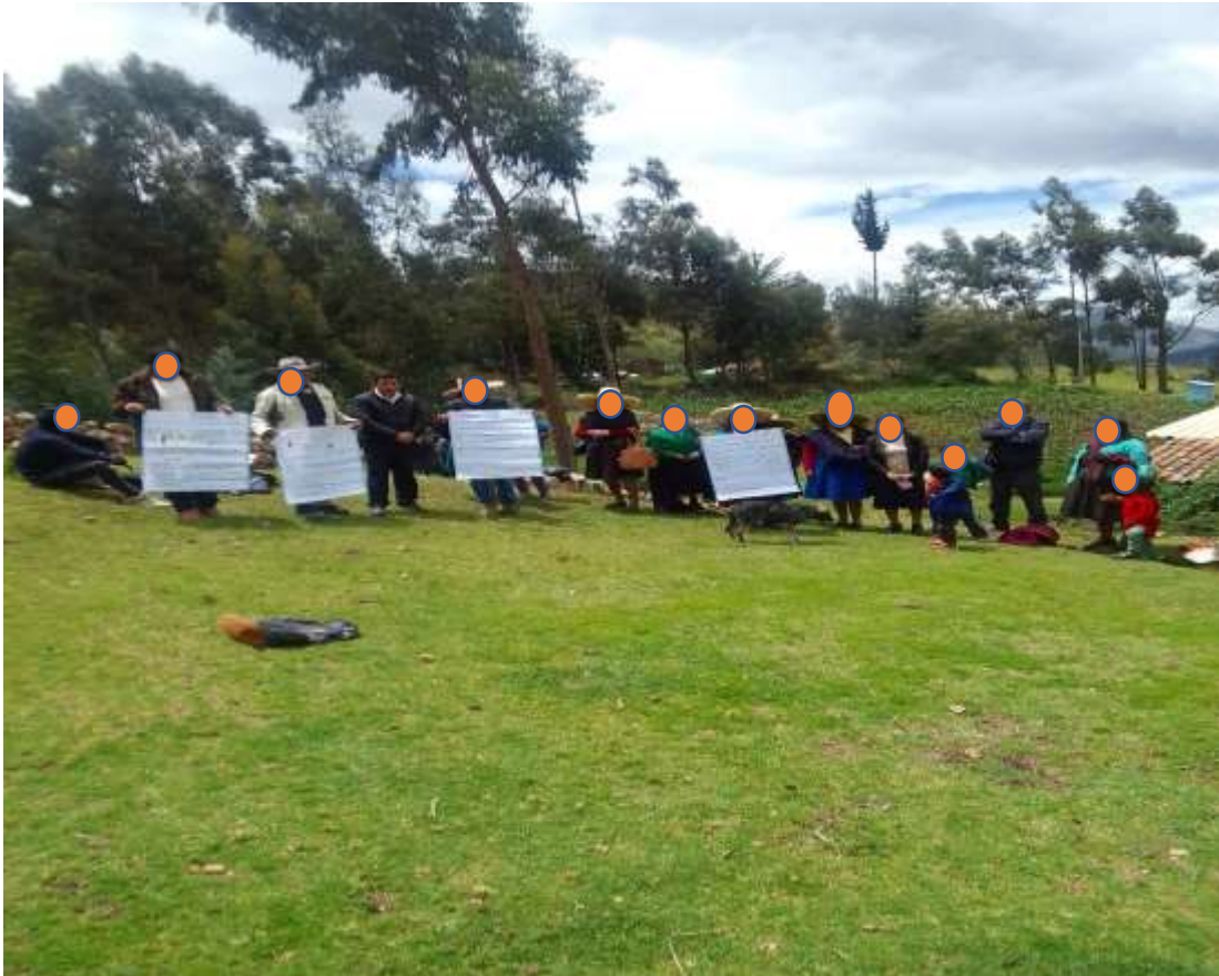
Culminación de la intervención en los pobladores de Cochás sobre uso adecuado de los medicamentos