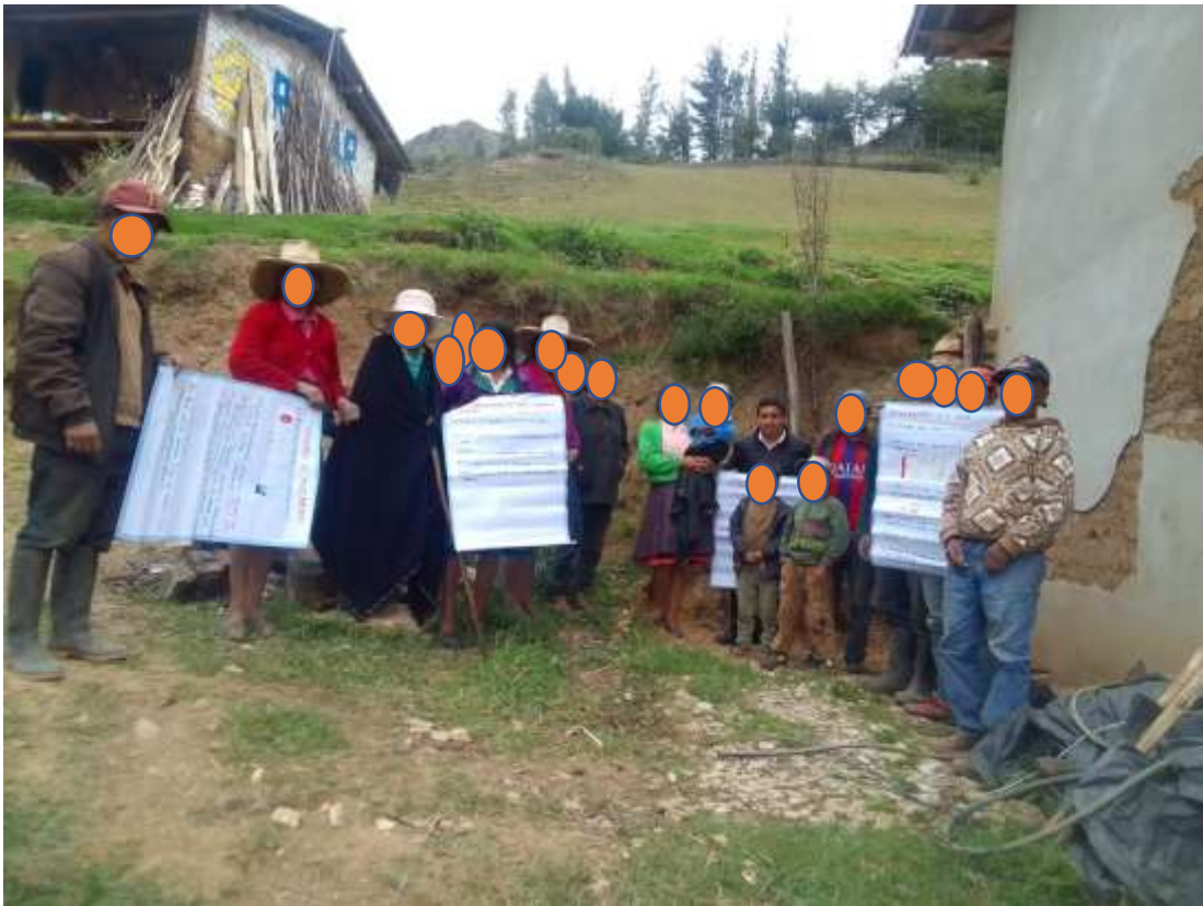
Ejecución y culminación de la intervención educativa de uso adecuado de los medicamentos grupo 1 de la mañana