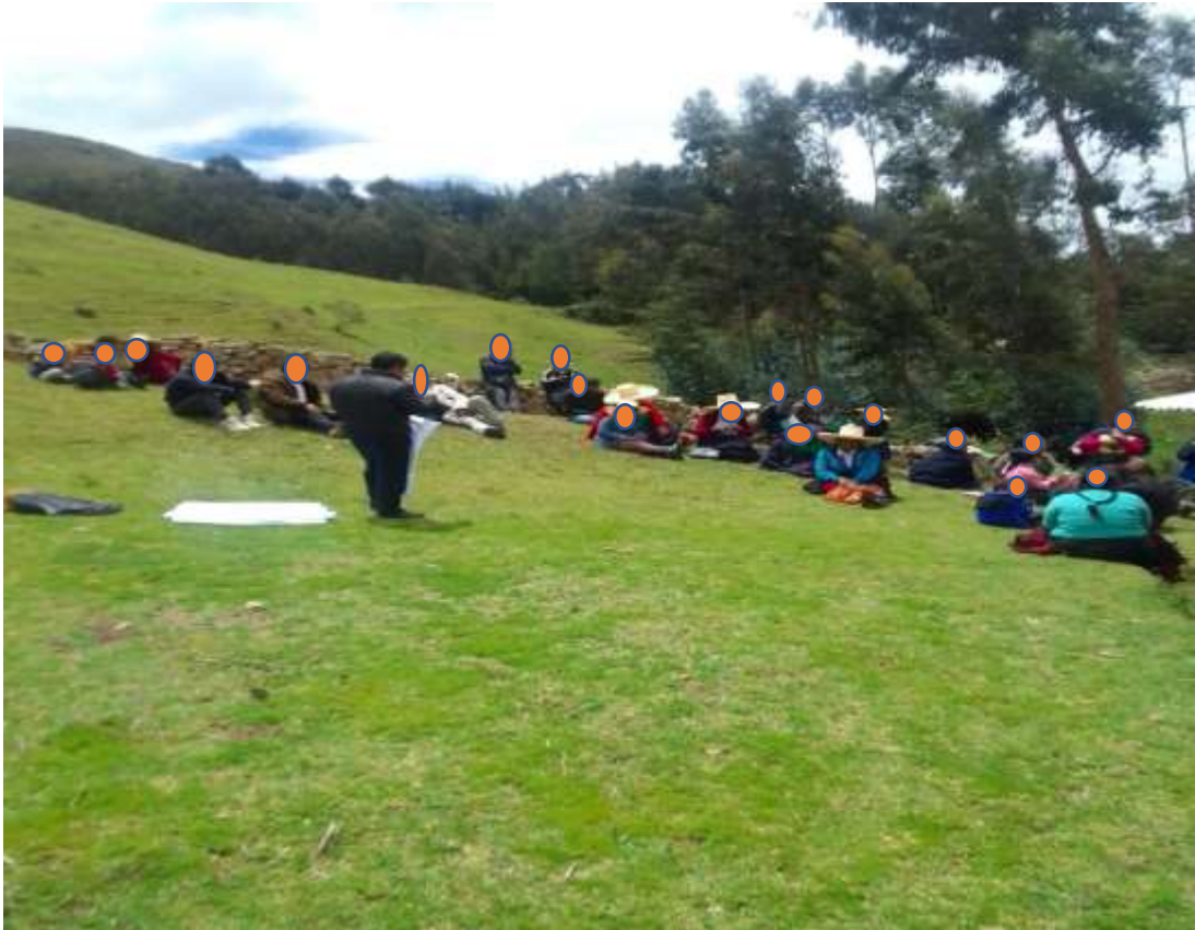
Segundo grupo de la tarde de los pobladores de Cochas en la intervención