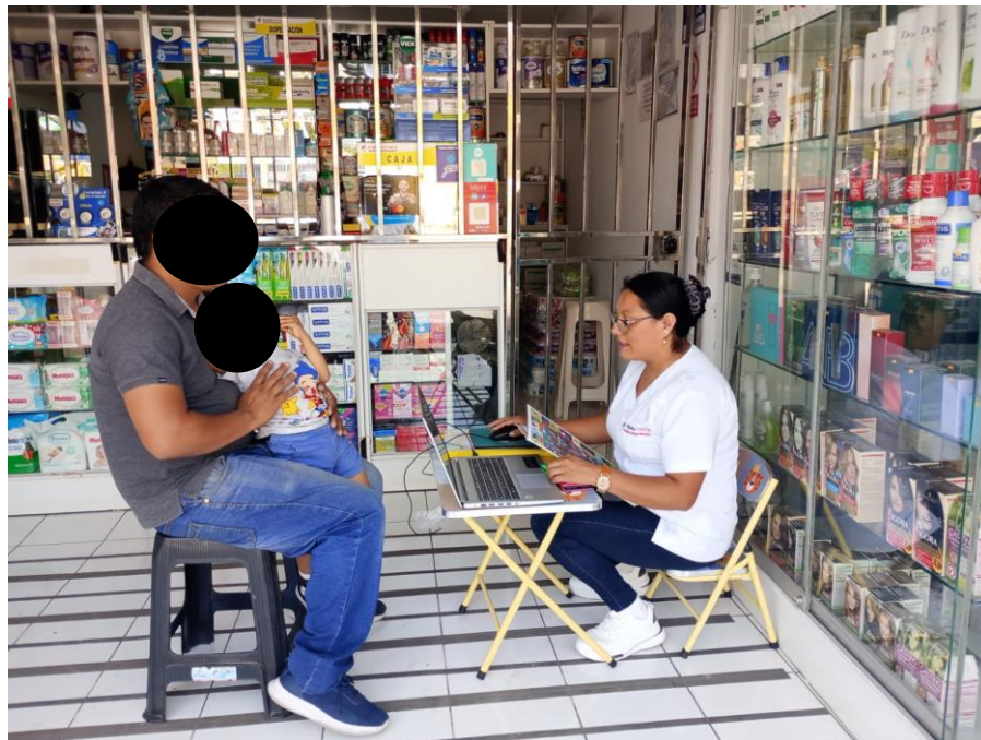
Aplicando el cuestionario a un paciente