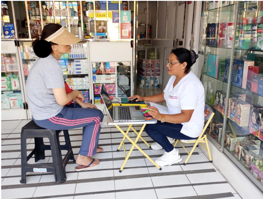
Aplicando el cuestionario a una paciente