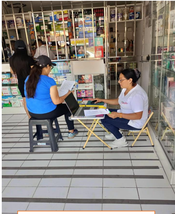
Leyendo el consentimiento informado