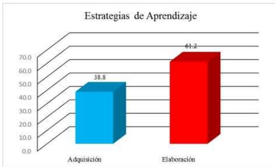
Gráfico 1. Estrategias de aprendizaje utilizadas por los estudiantes de Quinto Grado de Nivel Secundaria de Educación Básica Regular de la Institución Educativa Pedro Vilcapaza del distrito de Azángaro, región Puno, año 2016.