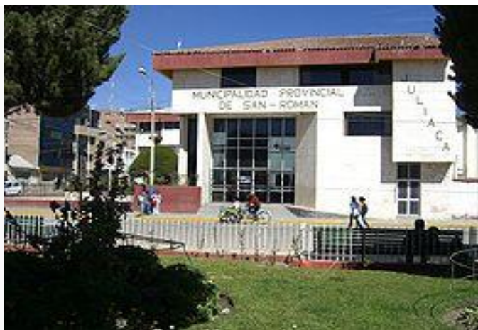
Municipalidad de Juliaca.

Juliaca (en quechua: Hullaqa) es la capital de la provincia de San Román y del distrito homónimo, ubicada en la jurisdicción de la región Puno, en el sudeste de Perú. Cuenta con una población de 225.146 habitantes (2007), situada a 3824 msnm en la meseta del Collao, al noroeste del lago Titicaca. Es el mayor centro económico de la región Puno, y una de las mayores zonas comerciales del Perú. Se halla en las proximidades de la laguna de Chacas, del Lago Titicaca, del río Maravillas y las ruinas conocidas como las Chullpas de Sillustani.