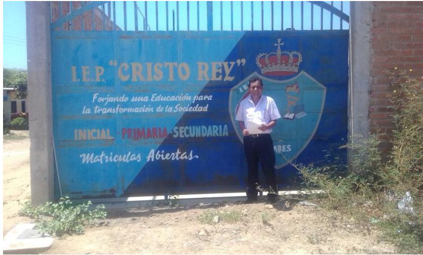
AUTOR REALIZANDO LAS ENCUESTAS I.E.P. CRISTO REY