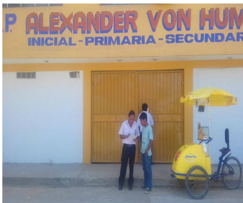
AUTOR RELIZANDO LAS ENCUESTAS EN LA I.E.P. ALEXANDER VON HUMBOLT