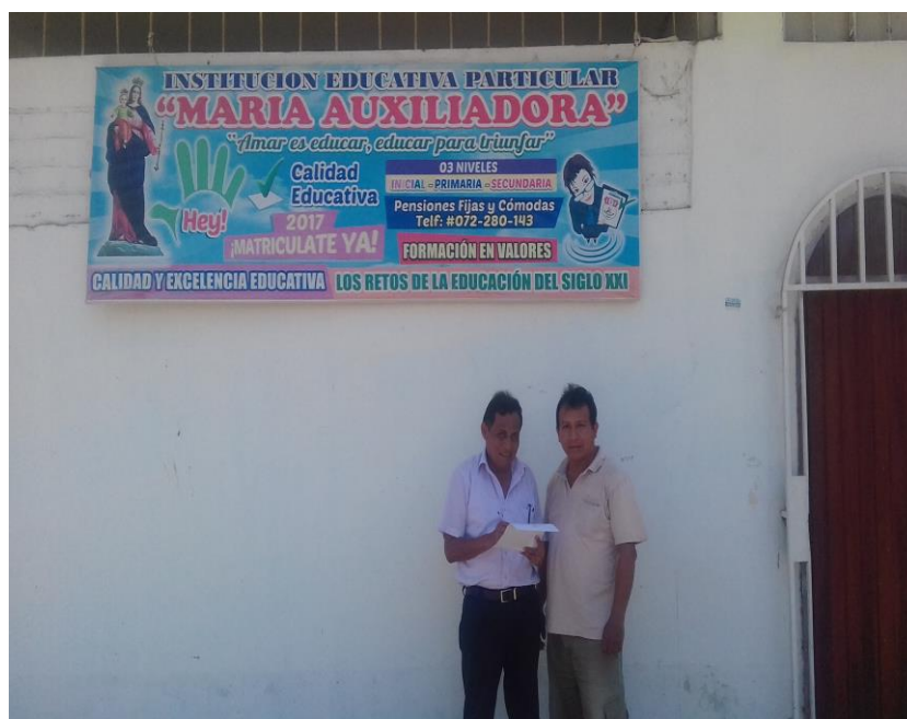
AUTOR REALIZANDO LAS ENCUESTAS I.E.P. MARIA AUXILIADORA