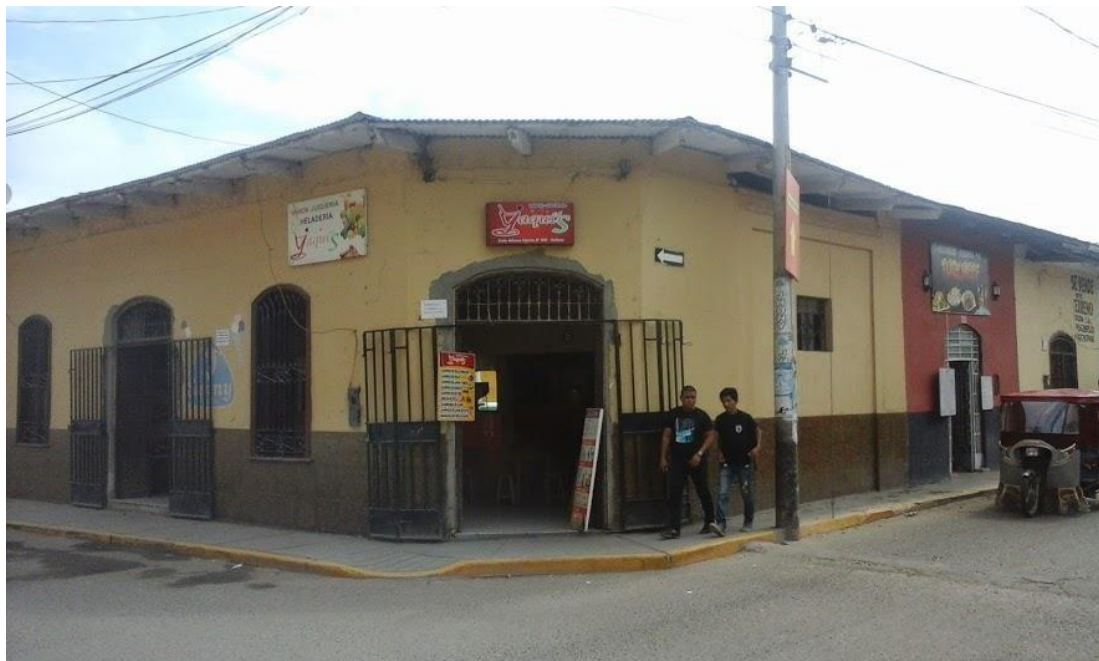
Figura 1. Ubicación de Juguería Yaquis

La Jugueria Yaquis se encuentra ubicada en la Calle Ugarte N° 900 – Sullana.