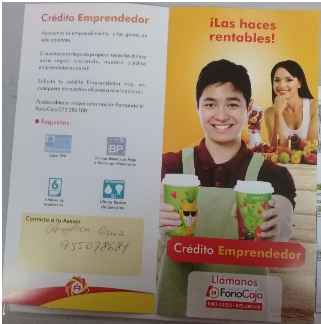
Figura 6. Folleto Caja Sullana (Requisitos Crédito emprendedor)