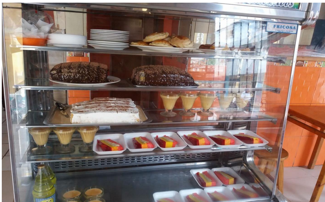
Figura 3. Postres