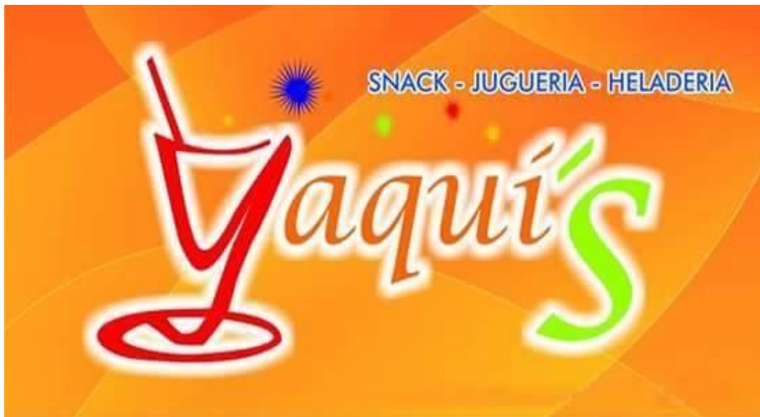
Figura 2. Logo Juguería Yaquis