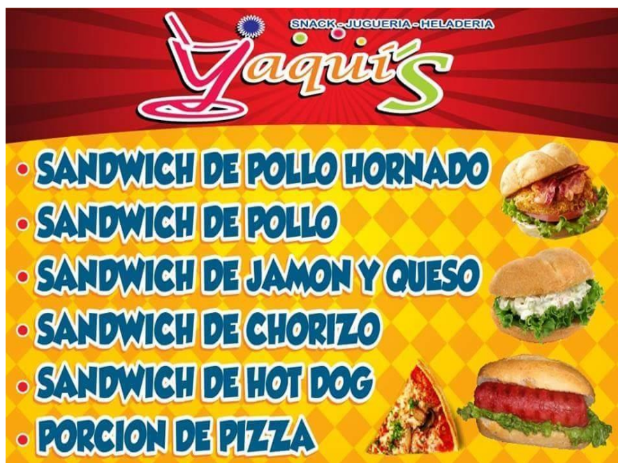
Figura 4. Sándwich