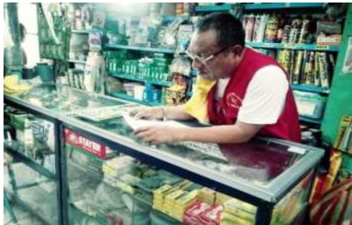
Ferretería Nunura E.I.R.L.