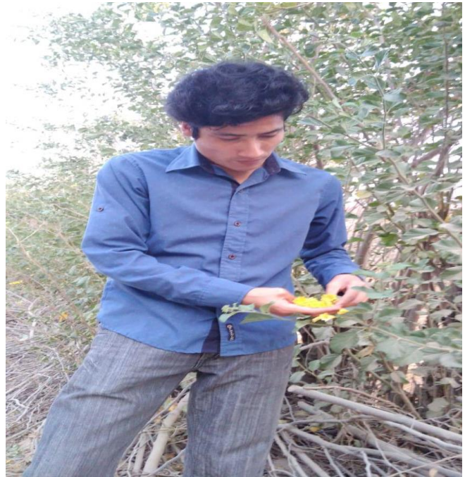
ANEXO N° 5