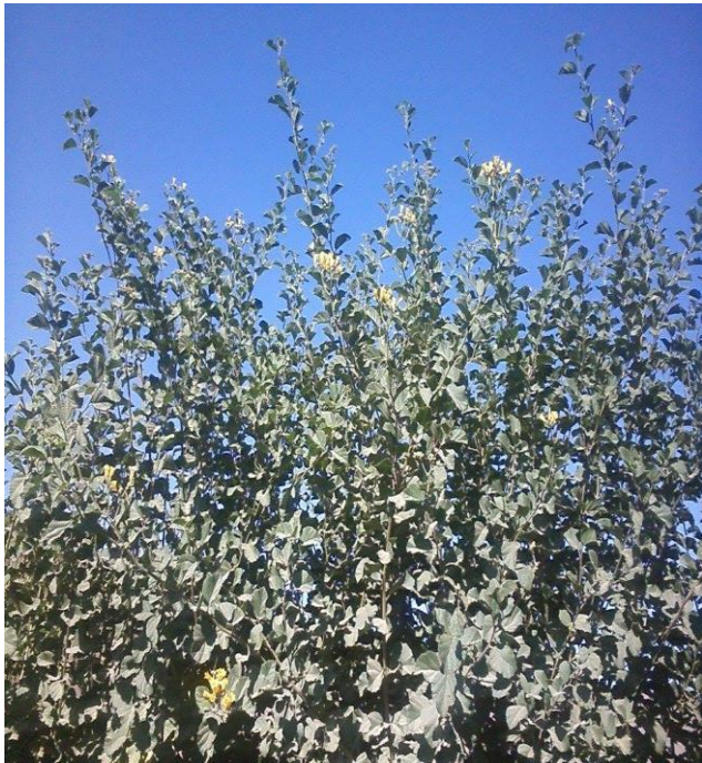
ANEXO N° 4