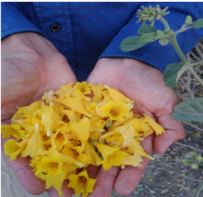
ANEXO N° 6